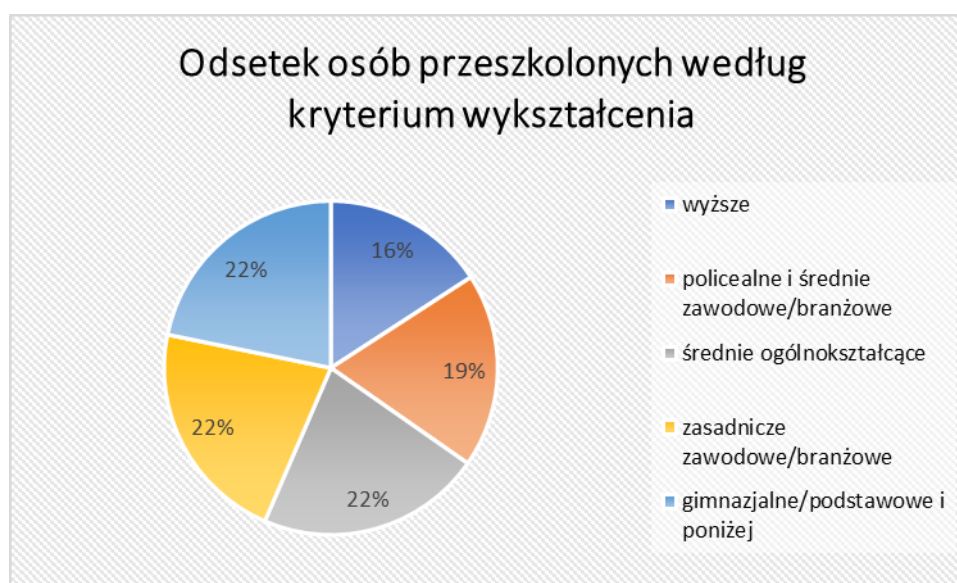
Wykres nr 2. Odsetek osób przeszkolonych wg kryterium wykształcenia

Najliczniejszą grupę osób, które ukończyły szkolenia w omawianym okresie stanowią osoby z wykształceniem średnim ogólnokształcącym, zasadniczym zawodowym/branżowym, oraz gimnazjalnym/podstawowym i poniżej- po 7 osób w każdej z grup. Następnie z policealnym i średnim zawodowym/branżowym – 6 osób, najmniej z wyższym- 5 osób.